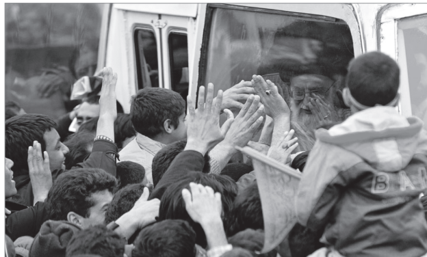
استقبال پر شکوه مردم یزد از رهبر انقلاب در سفر استانی، دی ماه ۱۳۸۶

○ س: مقصود از اهل کتاب چه کسانی است؟ معیاری که حدود معاشرت با آنها را مشخص کند چیست؟ ج: مقصود از اهل کتاب هر کسی است که اعتقاد به یکی از ادیان الهی داشته و خود را از پیروان پیامبری از پیامبران الهی (علی نبینا و آله و علیهم السلام) بدانند و یکی از کتاب‌های الهی را که بر انبیاء علیهم السلام نازل شده، داشته باشند مانند یهود، نصاری، زرتشتی‌ها و همچنین صابئین که بر اساس تحقیقات ما از اهل کتاب هستند و حکم آنها را دارند. معاشرت با پیروان این ادیان با رعایت ضوابط و اخلاق اسلامی اشکال ندارد. ●