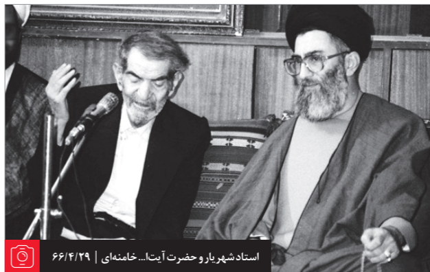
استاد شهریار و حضرت آیت... خامنه‌ای | ۶۶/۴/۲۹

اینکه این قدر صدای غدیر بلند شده است و این قدر برای غدیر ارج قائل شده‌اند- و ارج هم دارد- برای این است که با اقامه ولایت یعنی با رسیدن حکومت به دست صاحب حق، همه انحرافات