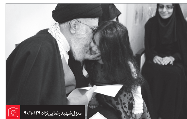
منزل شهید رضایی نژاد ۹۰/۱۰/۲۹

و ارزش این ائمه جمعه مظلوم ما به این نبود که یک-مثلاً- دستگاهی دارد، ارزششان به این بود که «خودی» بودند، با مردم بودند، برای مردم خدمت می‌کردند، مردم احساس کرده بودند که اینها برای آنها دارند خدمت می‌کنند و لهذا