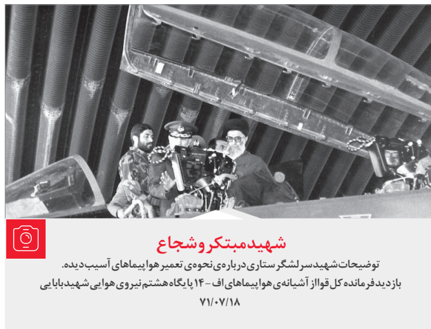
شهید مبتکر و شجاع توضیحات شهید سرلشکر ستاری درباره‌ی نحوه‌ی تعمیر هواپیماهای آسیب دیده. بازدید فرمانده کل قوا از آشیانه‌ی هواپیماهای اف-۱۴ پایگاه هشتم نیروی هوایی شهید بابایی ۷/۱۰/۱۸

اصل حکم تقلب نه؛ زیرا به هر حال کاری است که نباید تکرار کند، ولی تبعاتش قابل جبران است. مثلاً فردی که با تقلب مدرک گرفته و می‌خواهد با همین مدرک استخدام شود، اگر به مقدار آن مقطع تحصیلی که به خاطر آن پذیرش می‌شود معلومات ندارد، استخدامش صحیح نیست. ولی اگر درس بخواند و شرایط دیگر استخدامی را هم داشته باشد، استخدامش ایرادی ندارد و حقوقی هم که می‌گیرد مانعی ندارد. ●