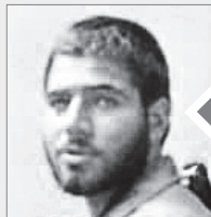
این شماره تقدیم می‌شود به روح پرفتوح شهید غلامعلی بیچک

دستخط رهبر انقلاب بر روی عکس حضور شهید غلامعلی بیچک در محضر امام خمینی (س)