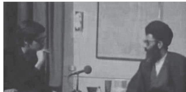
بازدید آیت الله خامنه‌ای از لانه جاسوسی آمریکا و صحبت با یکی از جاسوسان آمریکایی

خدا (صلی الله علیه و آله)، حضرت سجاد (علیه السلام) سایر ائمه، ملاحظه کنید چه جملاتی هست و ما چطور بعیدیم از این معانی، چه معارفی در این ادعیه هست که ما محرومیم از آن معارف، چه آتش سوزی در قلب این خاصان خدا بوده است