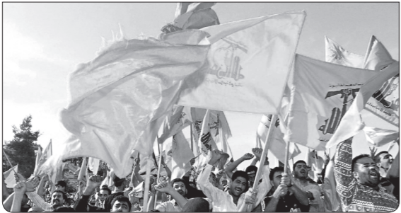
سالگرد پیروزی حزب‌ا... در جنگ ۳۳روزه